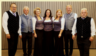
Stimmen aus Kärnten