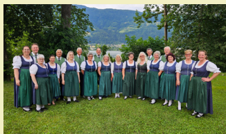
Gemischter Chor Gegendal