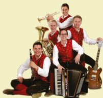
Die jungen fidelen Lavanttaler